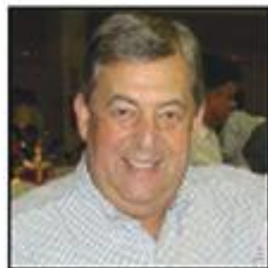
Boa leitura. Eduardo Biagi