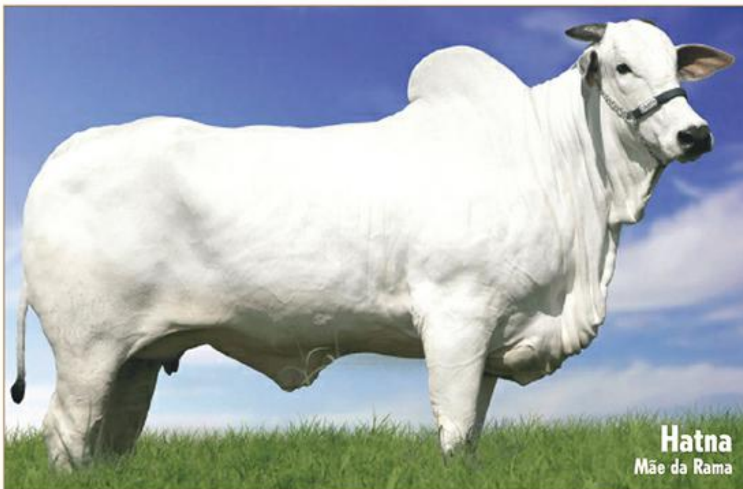
Hatna Mãe da Rama

Campeã Expozebu 2001, e da Espuma, Grande Campeã Ourinhos 2002. Já Rama é neta da consagrada Ryatna MJ do Sabiá, Bicampeã Nacional em Uberaba. O único macho do leilão, Rufus, é um bezerro de destaque da sua geração, filho da Kashimira, que é filha da Taibhara e irmã da Betina. "O objetivo do leilão é ofertar a melhor e mais produtiva genética Nelore e, por isso, teremos prenhezes e doadoras de destaque da Carpa." afirma a Sap, assessoria técnica do leilão. Com a organização do Programa Leilões, o 2º Leilão Virtual Elite Carpa de Prenhezes a Doadoras será realizado às 20 horas com transmissão ao vivo pelo Canal Rural.