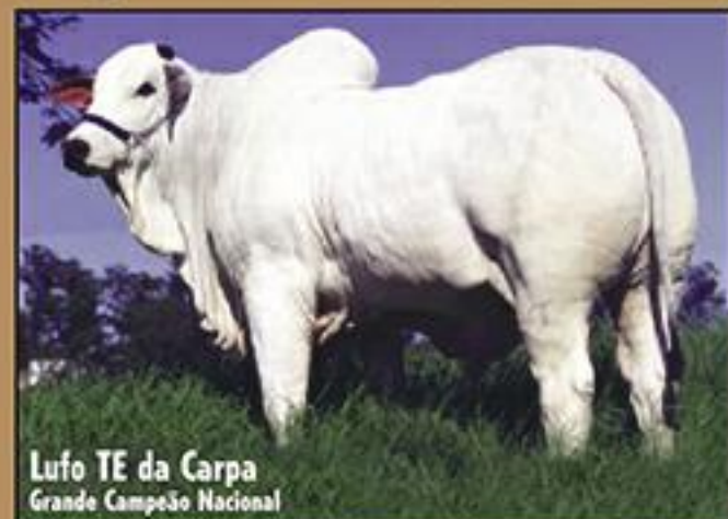
Lufo TE da Carpa Grande Campeão Nacional