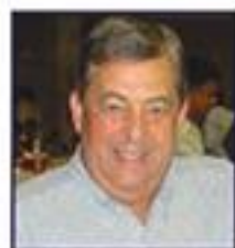
Boa leitura. Eduardo Biagi