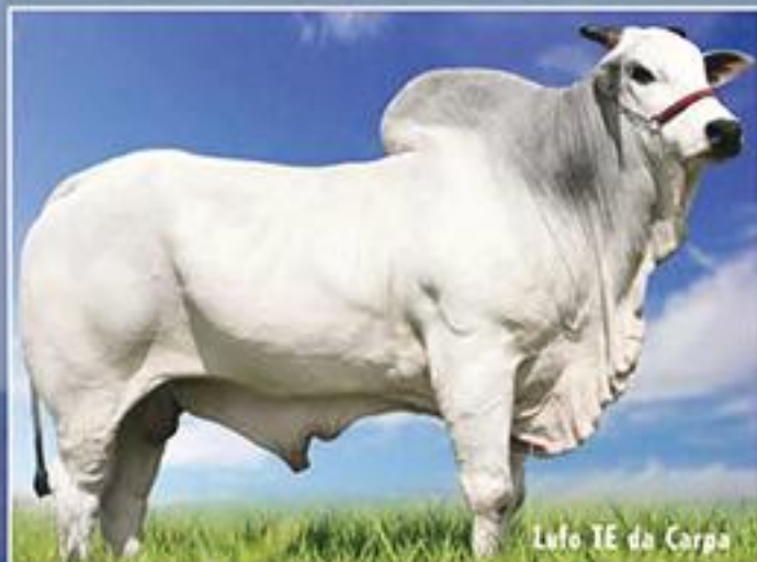
Lufo TE da Carpa

MGT 15,20 - TOP 0,5% + de 500 animais avaliados em 54 rebanhos