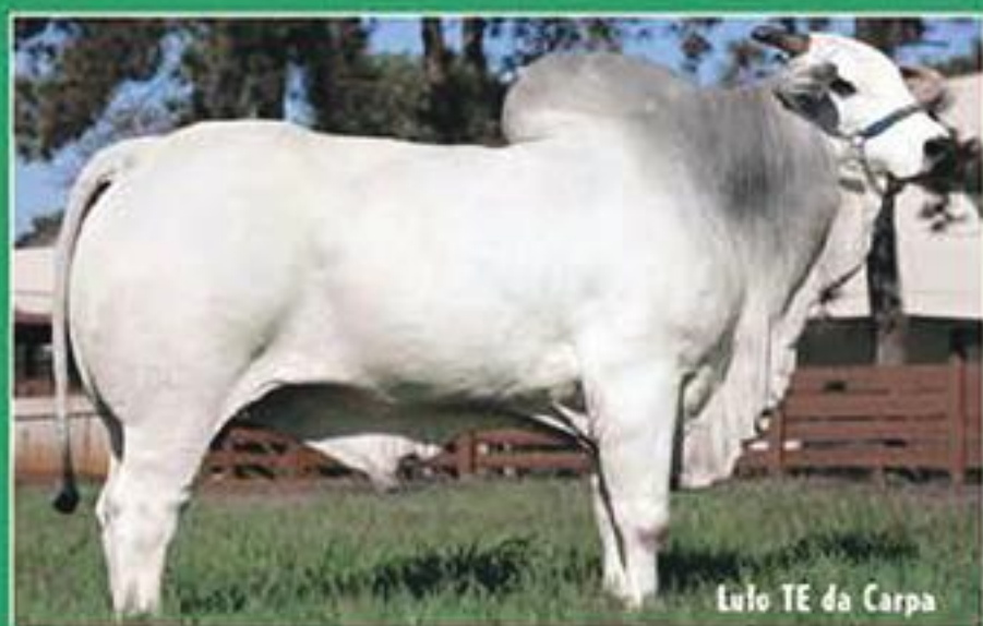
Lulo TE da Carpa

característica de alta correlação com a fertilidade. Já quem busca equilíbrio entre as diversas características avaliadas poderá escolher entre os touros de maior MÉRITO GENÉTICO TOTAL (MGT).