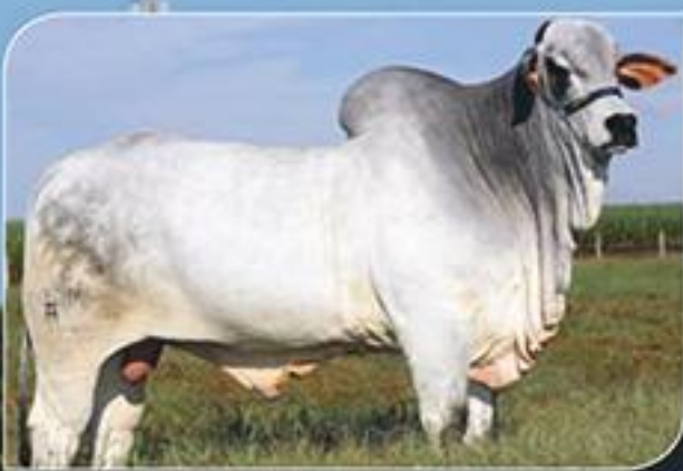
Detroit FIV Carpa Rambo da MN x Quilaia FIV da Carpa (Bitelo da SS)