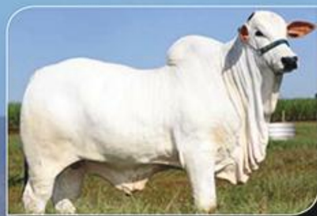
Volverine FIV Carpa Lufo TE da Carpa x Caira TE da Bal. (Bitelo da SS)