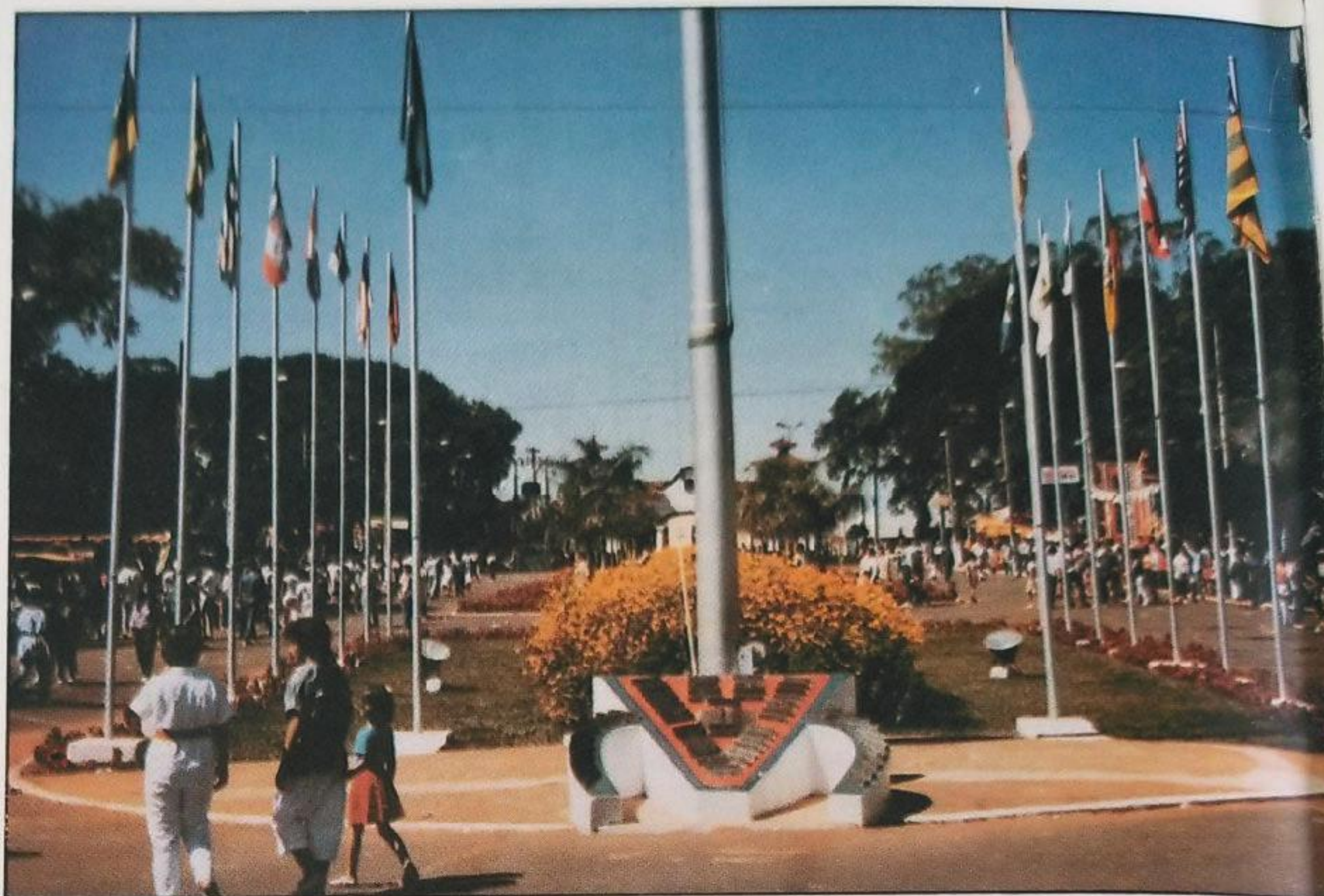
Visitantes vão gostar das novidades que encontrarão

Alterações mais importantes, porém, dizem respeito ao julgamento dos animais, que passou a ser mais exigente, para aferir o trabalho de melhoramento genético.